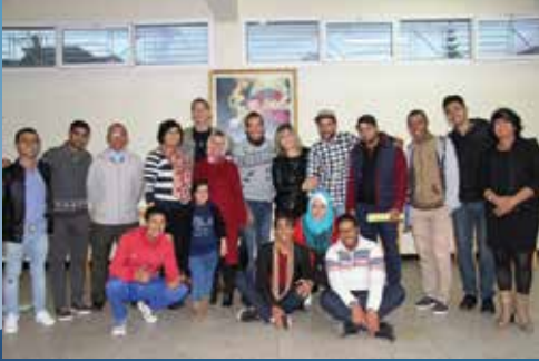
Associations OVCI la Nostra Famiglia, Casa Lahlina et les volontaires.

شباب من جماعة عين العودة التي لا تبعد عن مدينة الرباط إلى بقليل لكن يصعب الوصول إليها بوسائل النقل العمومي ، اغتبنوا مشروع التاهيل المجتمعي RBC ليصيروا نافعين في محيطهم . هاذا الفيلم الوثائقي يتتبع المغامرة.