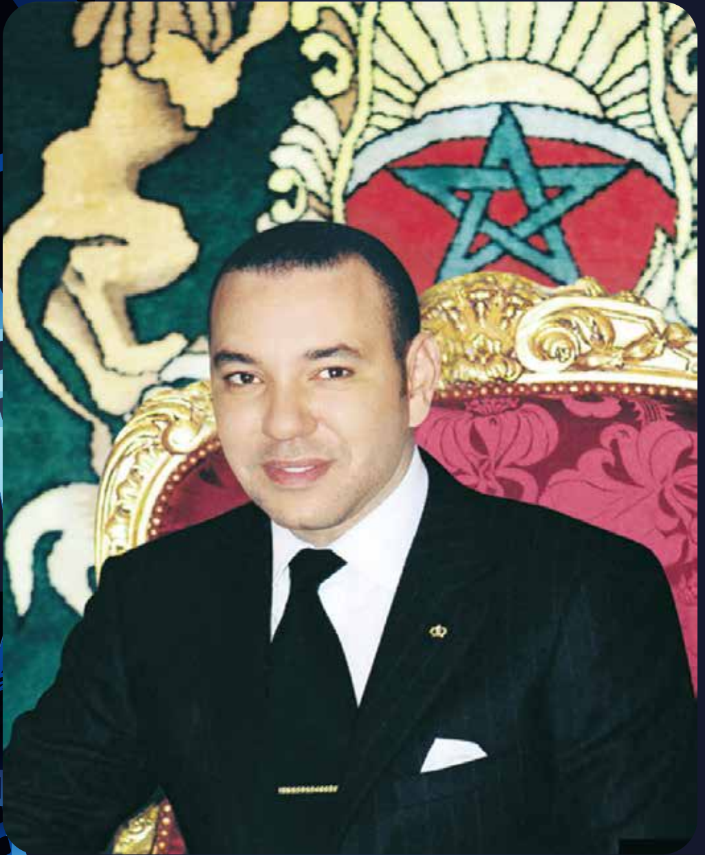
صاحب الجلالة الملك محمد السادس نصره الله Sa Majesté le Roi Mohamed VI que dieu l'assitse