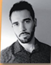
ماريو فنتورا - مخرج Mário Ventura Réalisateur