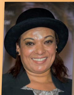
بشري أهريش - ممثلة مغربية Bouchra Ahrich Comédienne marocaine