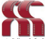
المركز السينمائي المغربي Centre Cinématographique Marocain