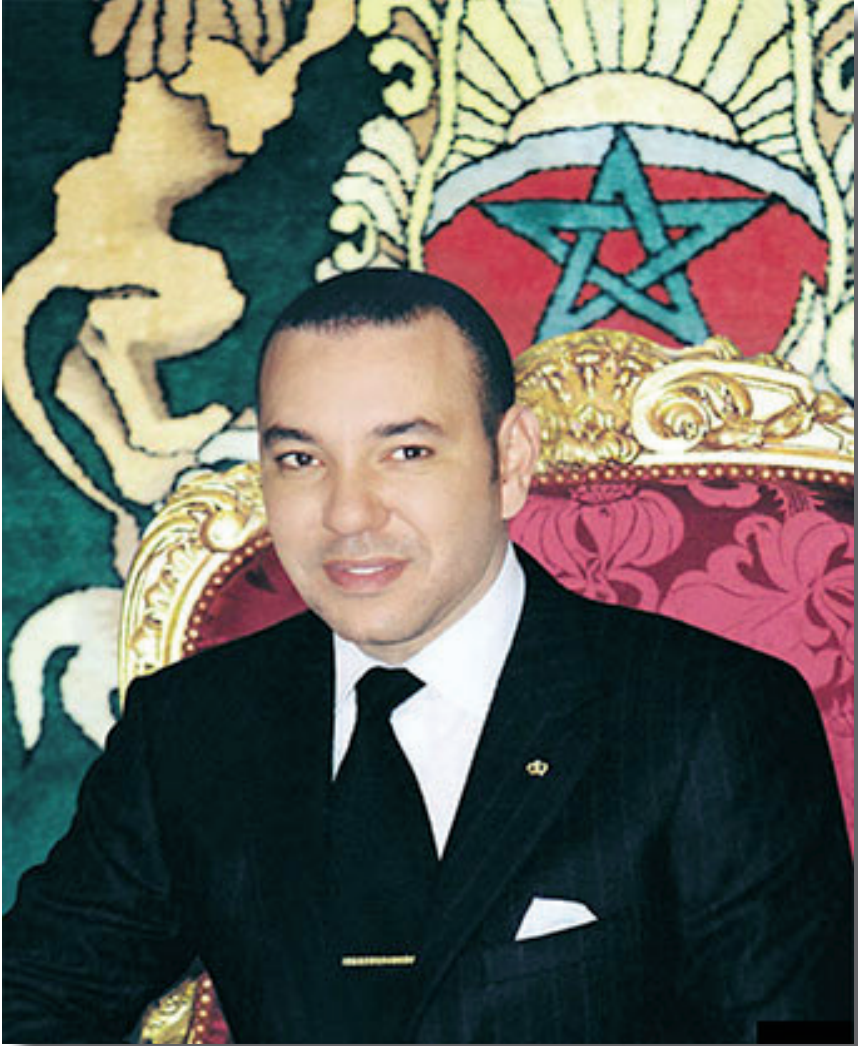
صاحب الجلالة الملك محمد السادس نصره الله Sa Majesté le Roi Mohammed VI que Dieu l'assiste