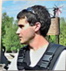
Mehdi NOBLESSE Réalisateur

عابر السبيل : مهووس بحدث تراجميدي (مؤلم) رايمون يبدأ بخوض مسيرة لسنوات عديدة. L'OMU DI A STRADA : Hanté par un tragique évènement, Raymond entreprend une marche de plusieurs années.