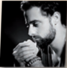
David Lucchini Réalisateur

إيزو لا تيرابي : امرأة شابة مصابة بالفصام ستختبر علاجاً تجريبياً أملها الوحيد هو الشفاء IZO LA THÉRAPIE : Une jeune femme atteinte de schizophrénie va essayer un traitement expérimental. Son unique espoir de guérison.