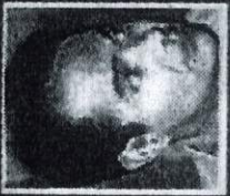
عمر بنجلون 1936 - 1975 شهيد صحافة الاتحاد الاشتراكي