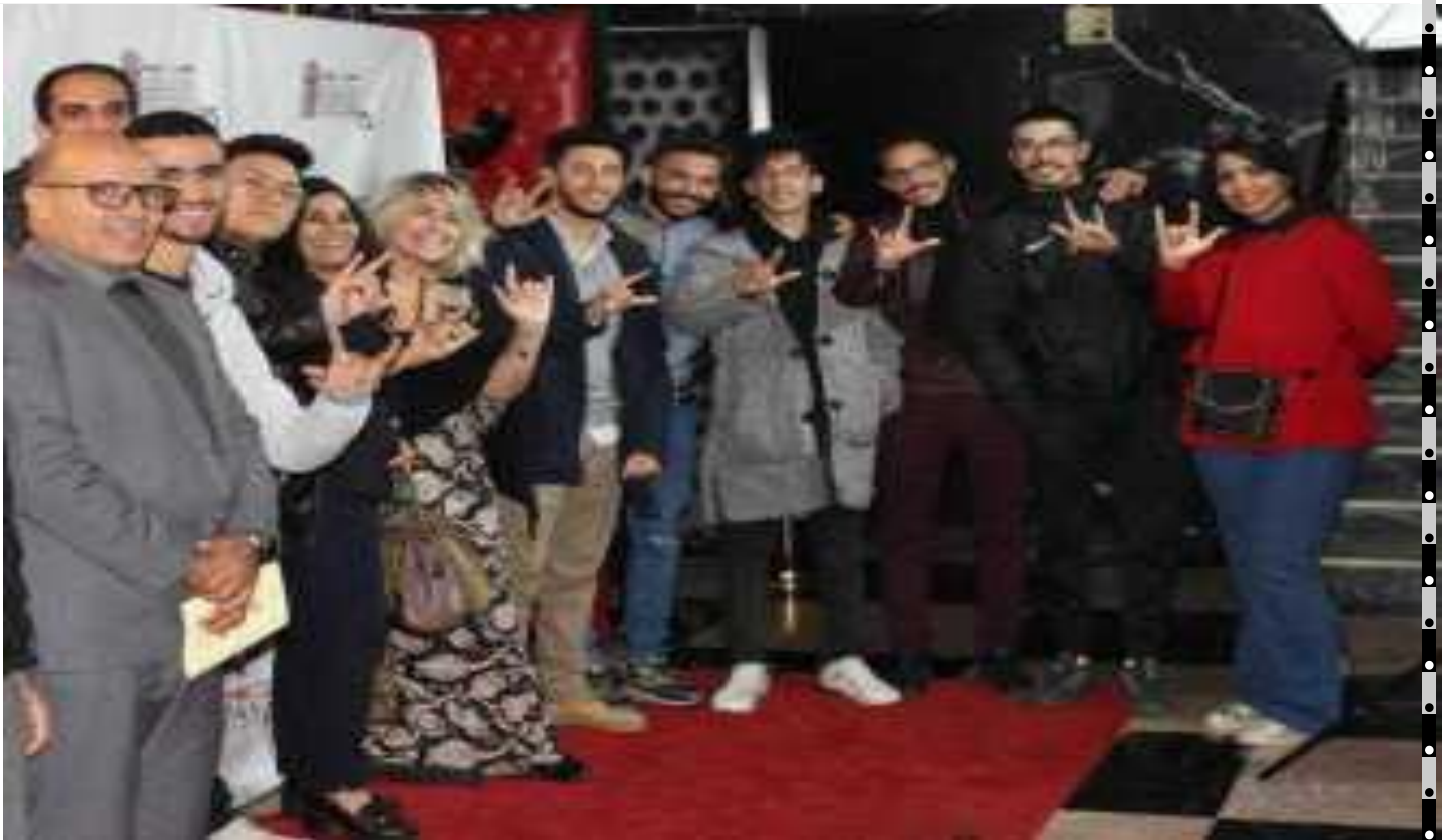
Quinzième édition du Festival Handifilm de Rabat

Les lycées publics marocains ont raflé les 4 prix de la compétition internationale du court métrage spécial juniors. Le lycée CFA Le Beausset a quant à lui reçu une mention spéciale du jury.